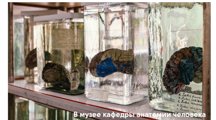
В музее кафедры анатомии человека

В один из таких «пространственных проскоков» я случайно открыла для себя кафедру биологии со стенами, полностью увешанными фотоматериалами и небольшими экспонатами. А потом и полуполюгендарную, по местным байкам, кафедру анатомии, которая оказалась невероятно увлекательной. И чем больше кафедр я находила, изучая и присматриваясь, тем чётче осознавала, что сама Джоан Роулинг позавидовала бы такому изобилию «факультетов» – разных по предметам изучения и методам работы, но таких неразделимых в своём главном стрем-